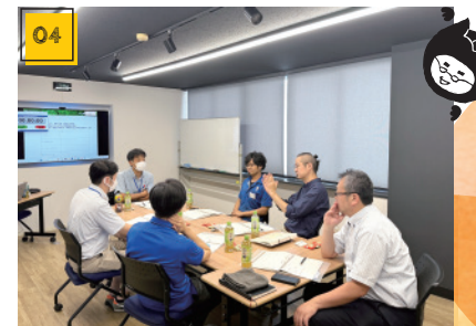
04 マネージメント研修 管理職向け。世代間ギャップの対処法など管理職ならではの悩みの共有もできる有益な機会です。