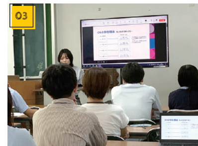
03 デジタル・IT勉強会 ITに明るい若手が自ら立ち上げた有志の会。ハードの基礎知識などゼロから丁寧に解説しています。