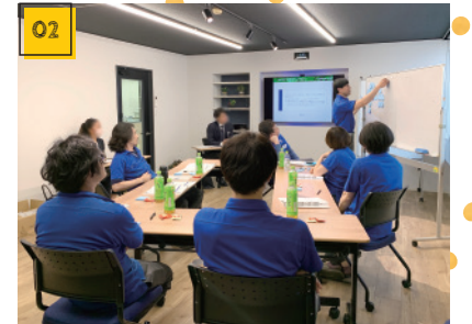
02 職場改善プログラム研修 写真は印刷オペレータたち。全員で意見を出し合い、自分たちで職場改善案を立案します。