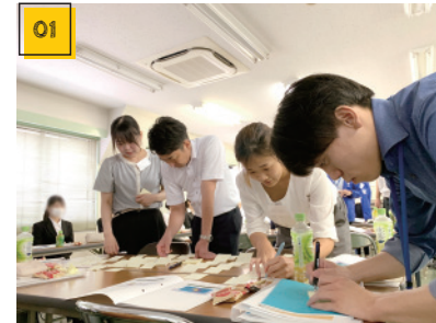
01 ロジカルシンキング研修 若手の営業スタッフ対象。過去には「新規営業」や「キャリア形成」などのテーマもありました。

今後も、お客様に対するサービスの充実と社員の働きやすさ向上のため、社員教育を続けていきますので、どうぞご期待ください。