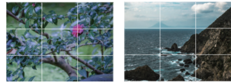
交点に被写体を配置した例 水平線を分割線に合わせた例

画面を縦横に三等分した線の交点に被写体やポイントとなる要素を配置します。被写体は4つの交点のどこに配置してもよく、水平線や垂直線を分割線に合わせる方法もあります。